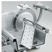
Removable food pusher VCS