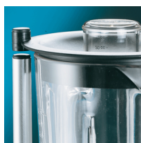
Microswitch on cover