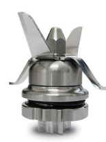
Removable s/steel knives assembly