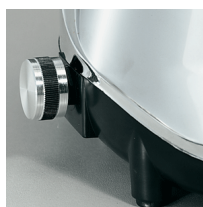
Variable speed device optional