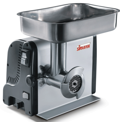
Sirman Мясорубки , model TC 8 Vegas :

Sirman Spa Viale dell'Industria 9/11 35010 PIEVE DI CURTAROLO (PD), Italy Tel./Fax. +39 049 9698666 / +39 049 9698688 email: info@sirman.com