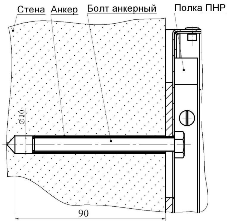
Рисунок 1. Пример крепления полки типа ПНР

Выбрать место для установки полки, разметить места под отверстия для установки анкерных болтов на расстоянии 870 мм (1000 мм – для полки ПНР-ЗД) друг от друга, просверлить отверстия диаметром 10 мм на глубину 90 мм, установить анкер и закрепить полку болтом в двух местах.