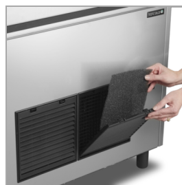
Легко очищаемый фильтр конденсатора