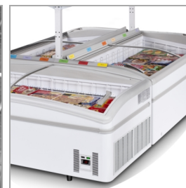
Установка островного типа, полки как принадлежности