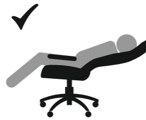
ВЕС ДОЛЖЕН БЫТЬ РАСПРЕДЕЛЕН НА ВСЕ СИДЕНЬЕ