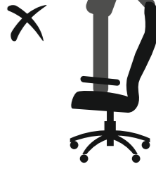
НЕ СТОЙТЕ НА КРЕСЛЕ