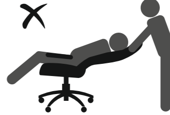
НЕ ОПИРАЙТЕСЬ НА СПИНКУ