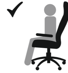
СИДИТЕ НА ВСЕМ СИДЕНИИ