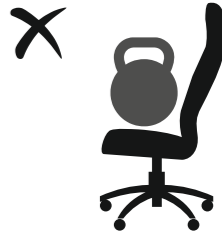
НЕ ПРЕВЫШАТЬ ДОПУСТИМЫЙ ВЕС