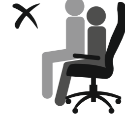
КРЕСЛО НЕ РАССЧИТАНО ДЛЯ ДВОИХ ЛЮДЕЙ!