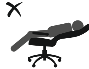
НЕ ОПИРАЙТЕСЬ НА СПИНКУ