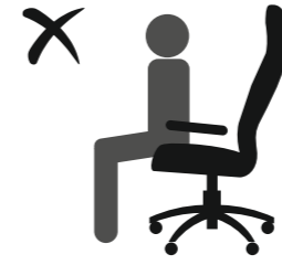
НЕ СИДИТЕ НА КРАЮ