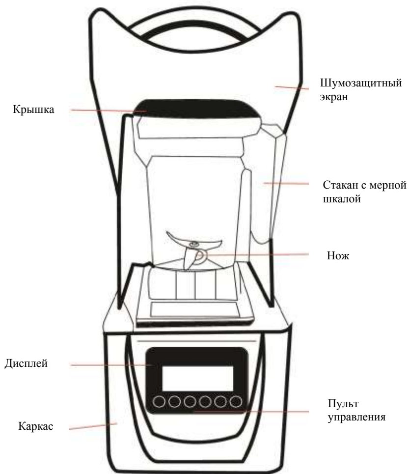
Рис. 1 - Блендер Обозначения