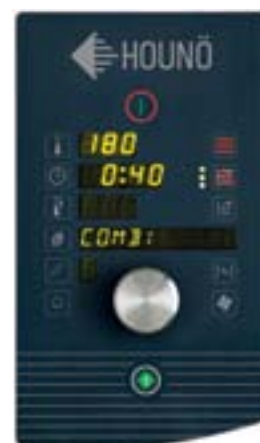
С стандартная модель