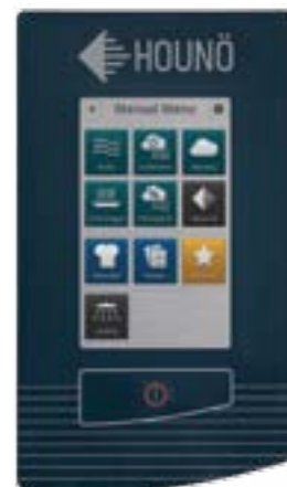
СРЕ сенсорная модель