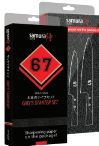
SD67-0220 НАБОР ИЗ ТРЕХ НОЖЕЙ SD67-0010, SD67-0023, SD67-0085