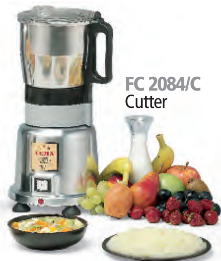
FC 2084/C Cutter

■ Frullacutter con 2 funzioni: Frullatore per uso con base liquida, Cutter per uso anche senza liquido. Le diverse velocità di lavorazione sono attivate dal semplice cambio del bicchiere sulla base in comune. Dotato di 2 bicchieri differenti in acciaio inox (acquistabile anche separatamente il solo cutter con il cod. FC 2084/C) con gruppo lame diversi. Dotato di interruttore a 2 velocità e pulsante per funzionamento intermittente. Ideale, nella funzione Cutter, per realizzare preparazioni non attuabili con il frullatore.