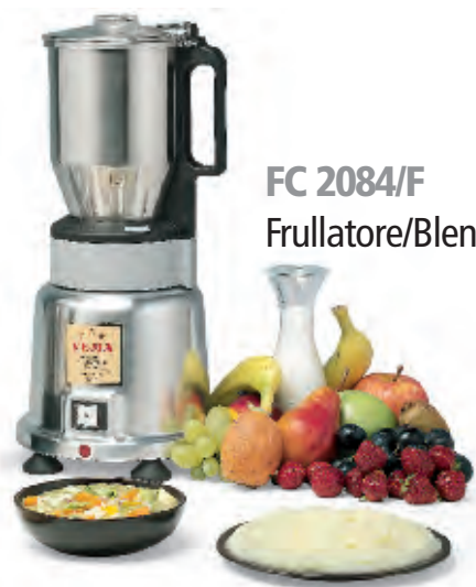
FC 2084/F Frullatore/Blender