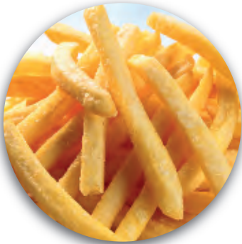
PATATINE FRENCH FRIES