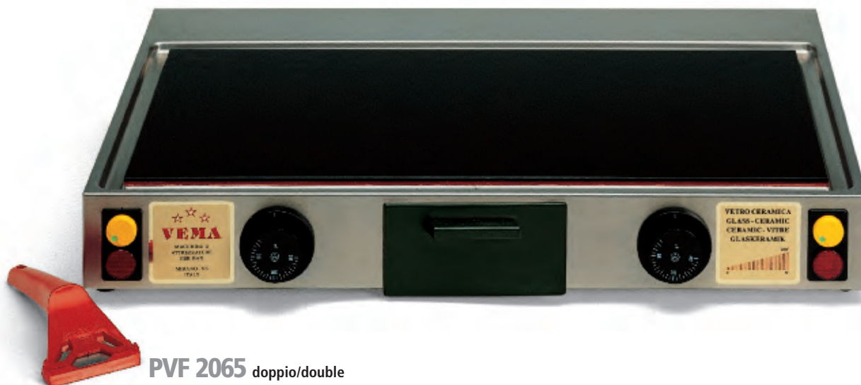
PVF 2065 doppio/double