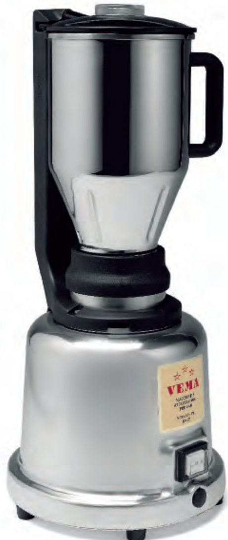
FR 2055 INOX