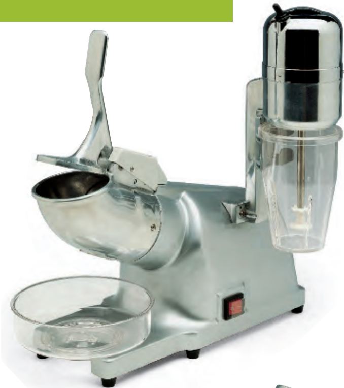
TRFL 2012 con frullino frappè with shaker