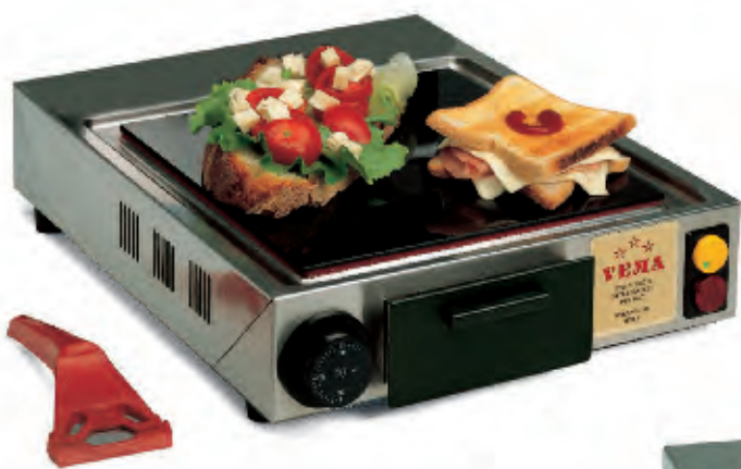
PVF 2079 singolo/single