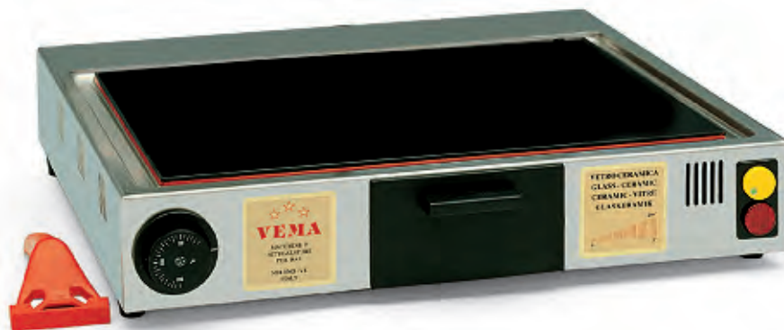
PVF 2046 medio/medium