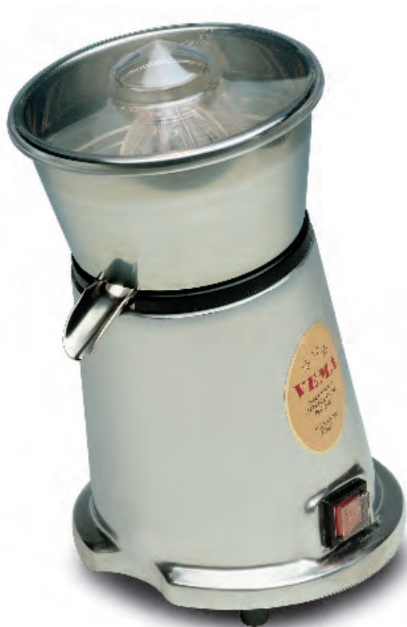
SP 2024 con corpo in alluminio with aluminium body