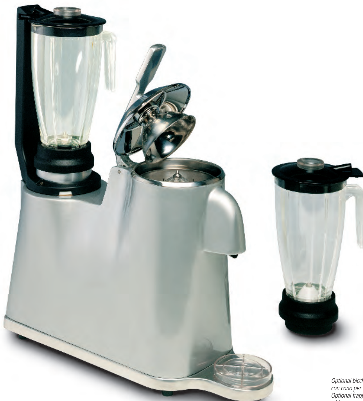
Optional bicchiere con cono per frappé Optional frappé jug with cone