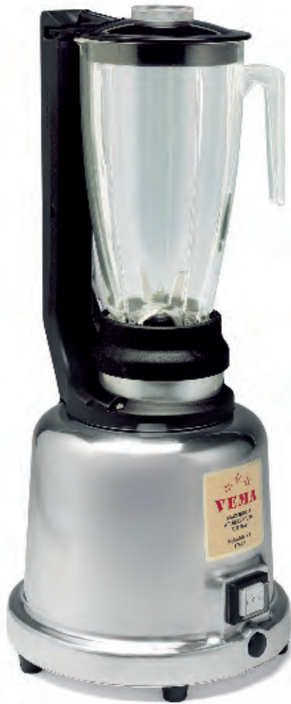
FR 2055 TRASP