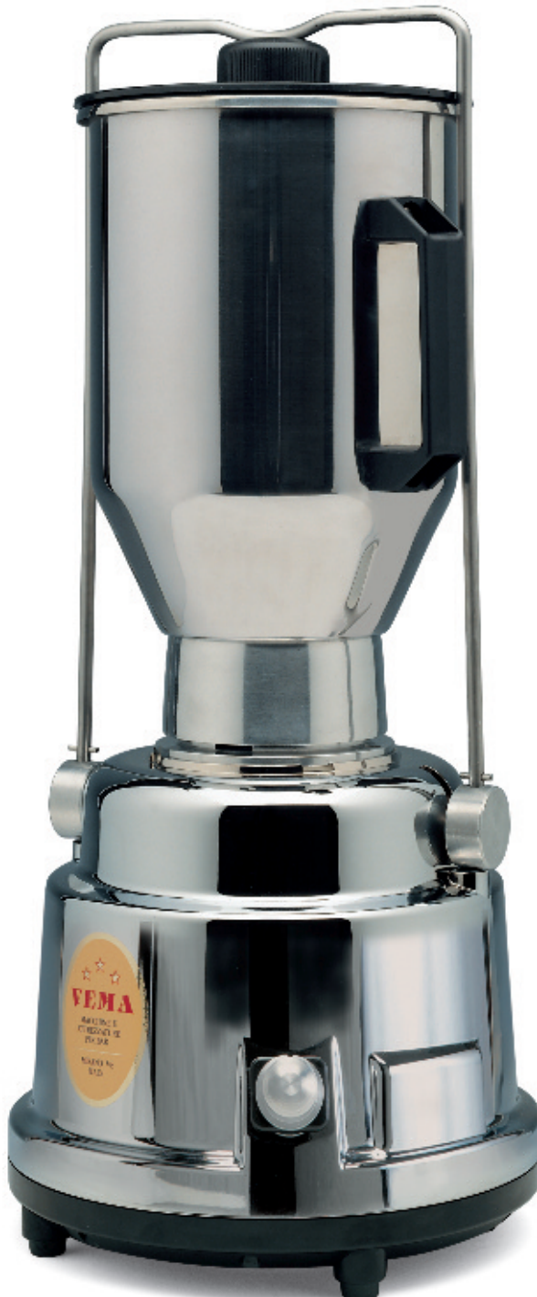
FR 2010 TURBO