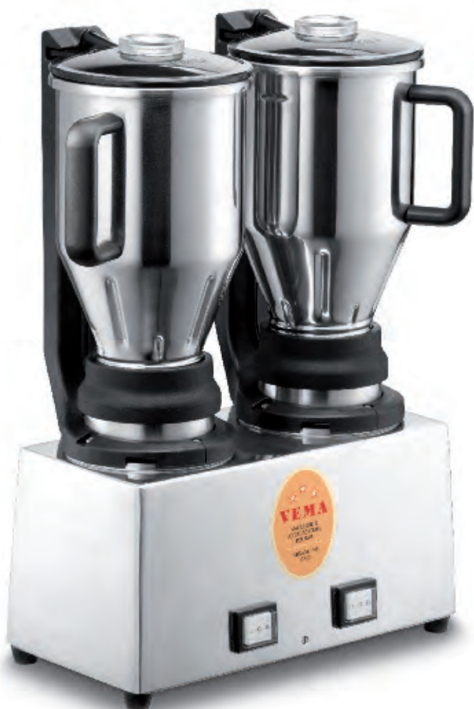
FR 2003/L con bicchieri inox with s. steel jugs