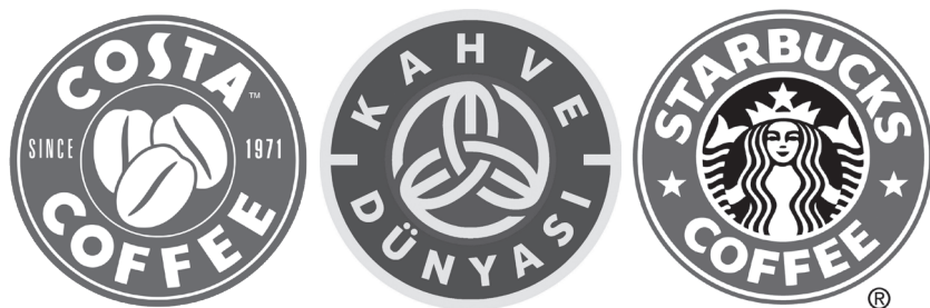
Рис.6. Новый логотип Costa Coffee помещен на вывеску, тогда как канонические три кофейных зерна используются в качестве внешнего оформления витрины.