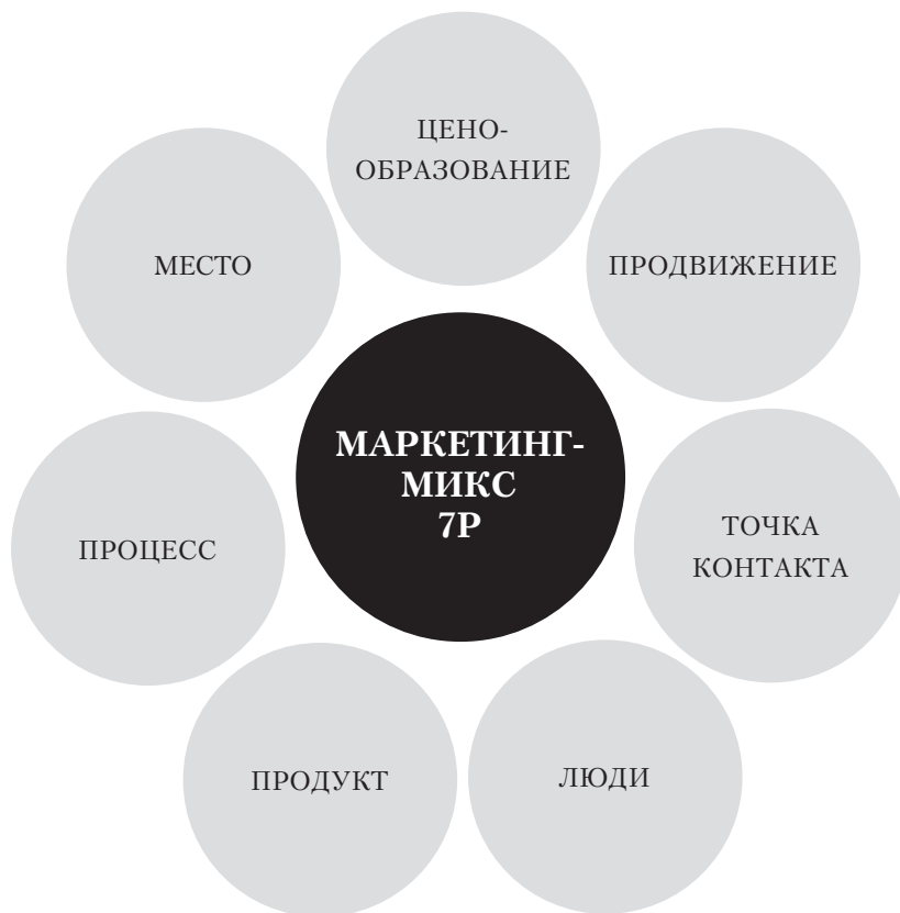
Рис.2. Модель концепции маркетинг-микс 7Р.