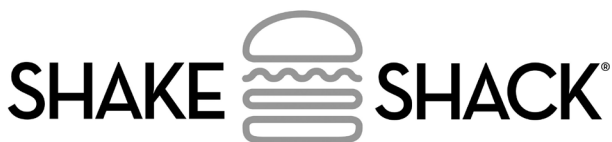
Рис.9. Первый Shake Shack в парке у Madison Square.

который был выбран для логотипа, сегодня украшает металлические буквы перед каждым заведением Shake Shack по всему миру.