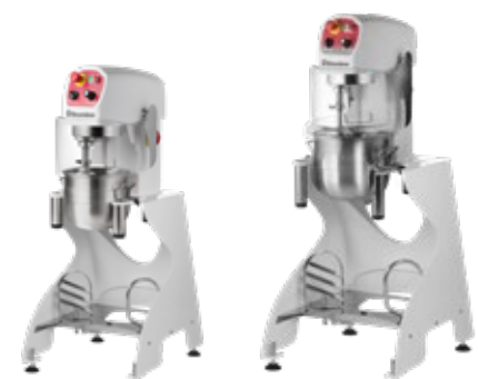
SM 12 + TROLLEY