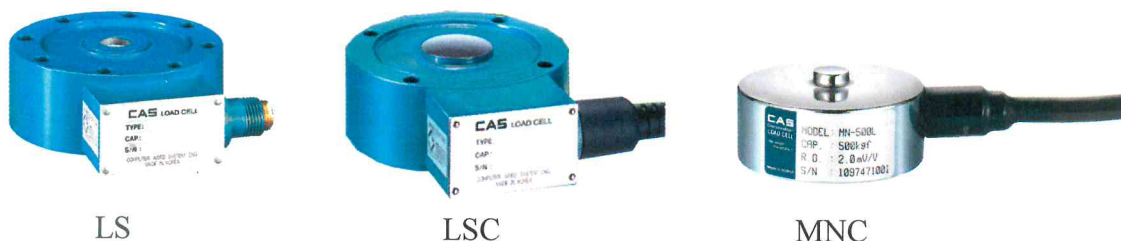
Рисунок 1 – Общий вид датчиков

Вид нагрузки датчиков – растяжение-сжатие (LS), сжатие (LSC, MNC). Датчики LS и LSC изготавливаются из прокатной стали, датчики MNC – из нержавеющей либо окрашенной стали.