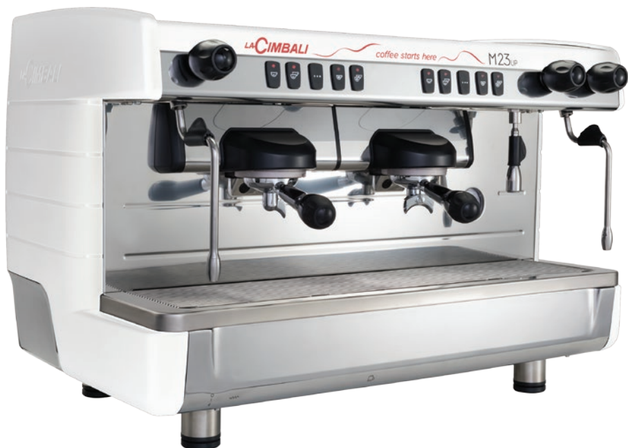
DT2 White version