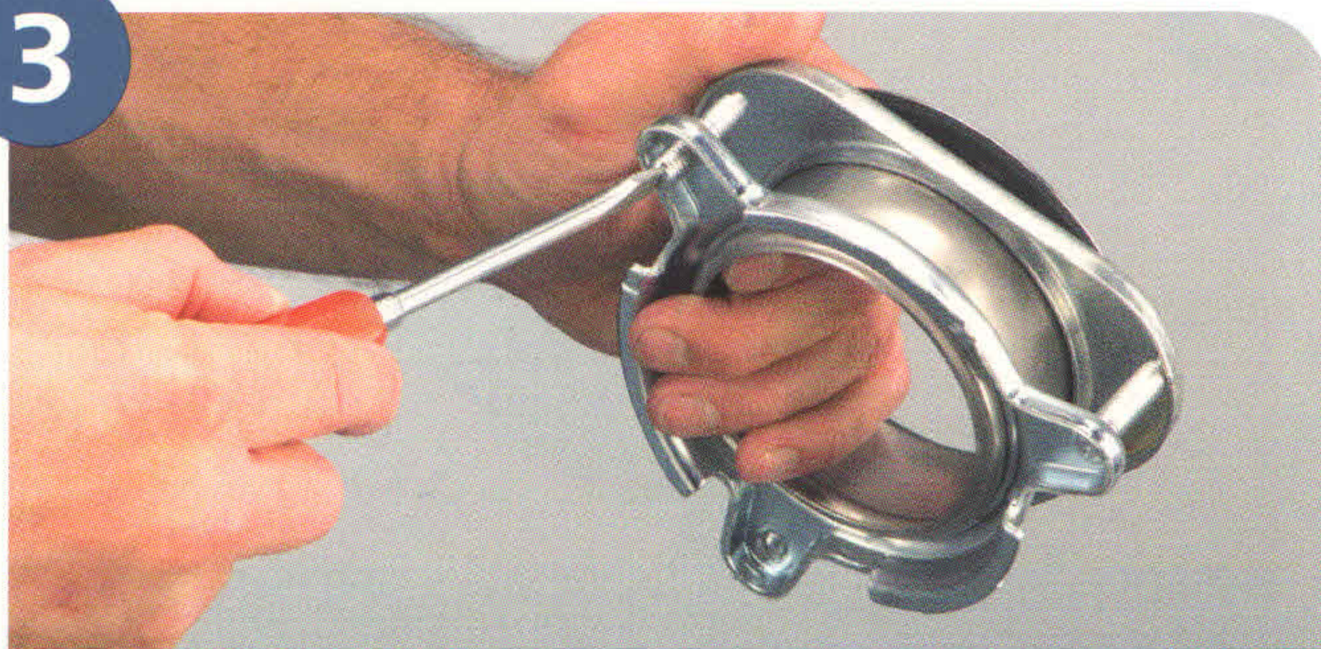
Разборка горловины диспоузера QuikLock (быстрый замок)