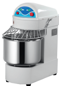
HS 20A/20B/30B/ 40B/50B