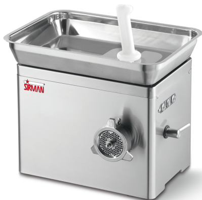
Sirman Мясорубки , model TC 22 Nevada :

Sirman Spa Viale dell'Industria 9/11 35010 PIEVE DI CURTAROLO (PD), Italy Tel./Fax. +39 049 9698666 / +39 049 9698688 email: info@sirman.com