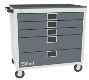
Тумбы SMART 5М