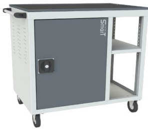
Тумбы SMART 1М