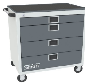
Тумбы SMART 4М