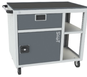
Тумбы SMART 1-1М