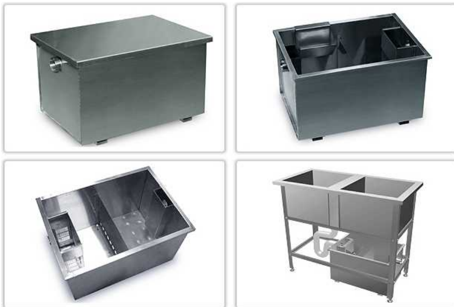
Рис. 1 Жироуловитель

4.1 Корпус жироуловителя представляет собой сварную герметичную емкость с перегородками. Все детали изготовлены из нержавеющей стали, что обеспечивает надежную антикоррозионную защиту. Перфорированный лоток для сбора крупных частиц - съемный. Для обслуживания жироуловитель оборудован съемной крышкой, конструкция которой препятствует проникновению запахов наружу.