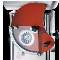
Optional patty former