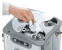
Compartment for knives and plates