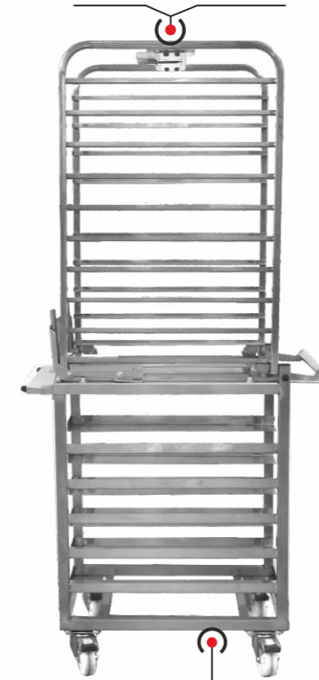
Подкатная тележка (опция)