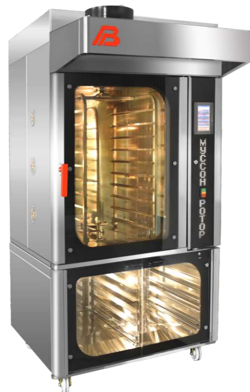
Ротационная печь «Муссон-ротатор» модель 33М на подставке