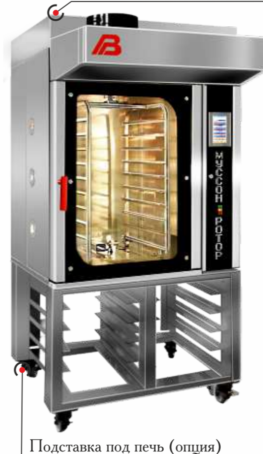
Подставка под печь (опция)