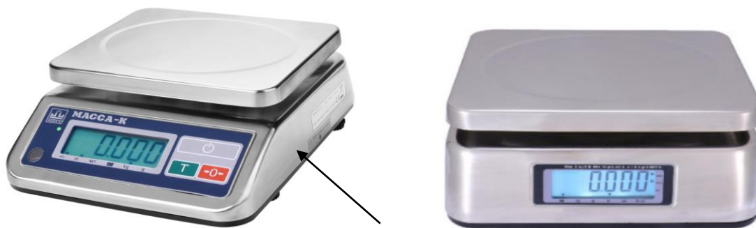
Рисунок 1 – Общий вид весов и место нанесения знака поверки

В весах предусмотрены следующие устройства и функции: