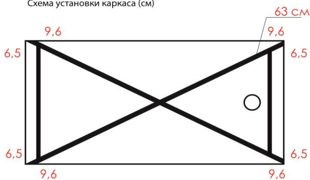
Схема установки каркаса (см)

клипса (металл) - 4 шт. магнитное крепление - 2 шт.