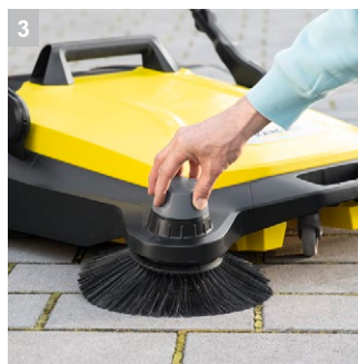
3 Регулировка высоты установки боковых щеток