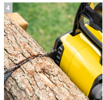
4 Зубчатый упор