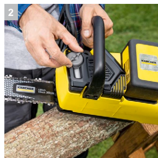
2 Автоматическое смазывание цепи