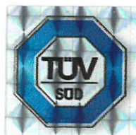
Leiter der Zertifizierungsstelle