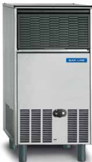
B 7540 AS/WS

La rinnovata gamma di produttori di ghiaccio in cubetti BAR-LINE produce cubetti di forma tronco-conica ad alta efficienza: definiti, limpidi, igienici e robusti per conferire ad ogni bevanda un naturale senso di freschezza.