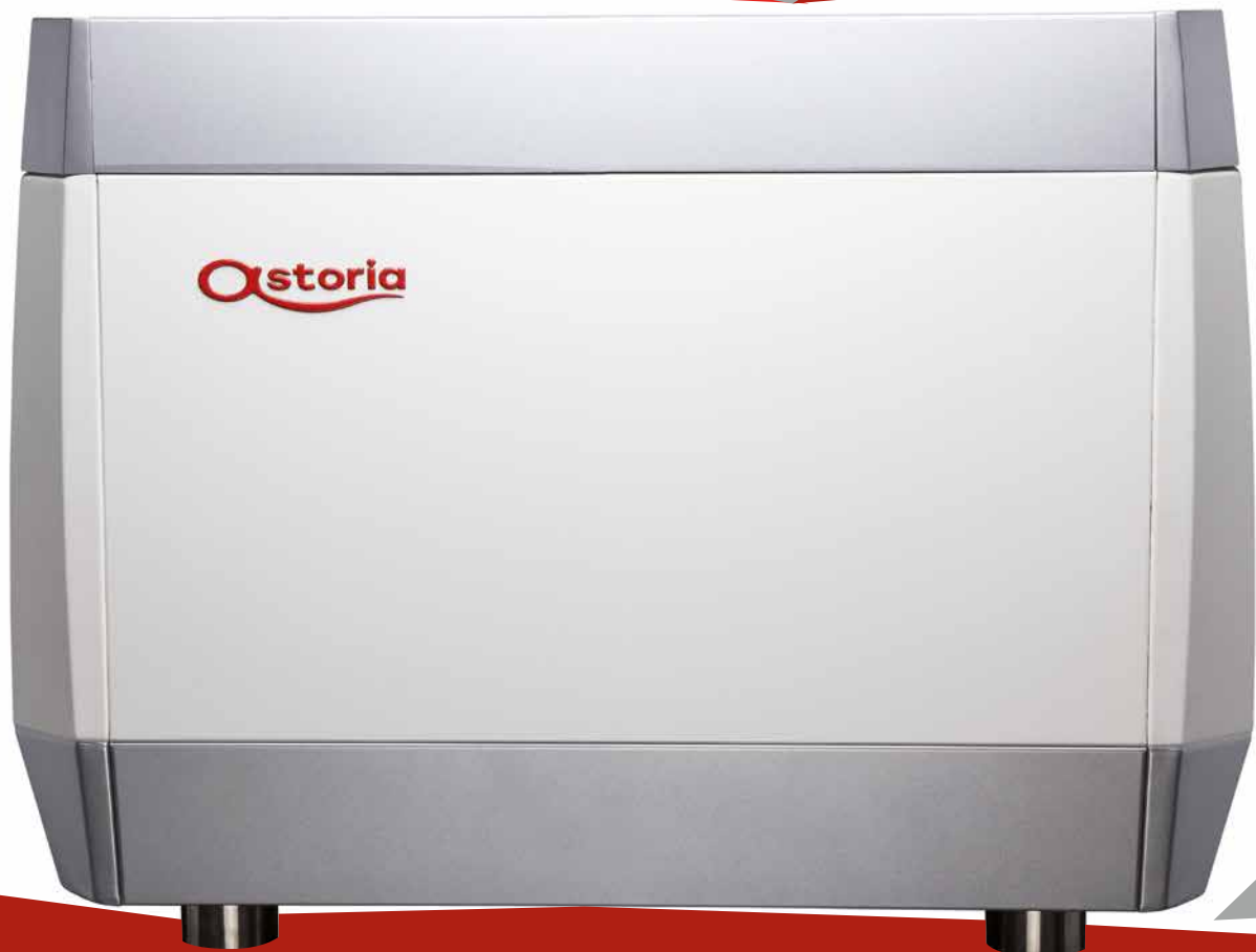
SAE TS | Electronic Automatic System - Touch Screen